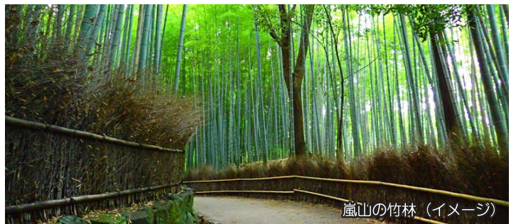
嵐山の竹林 (イメージ)

■食事 / なし ■最少催行人数 / 6名様 ■添乗員 / なし (通訳が同行致します)