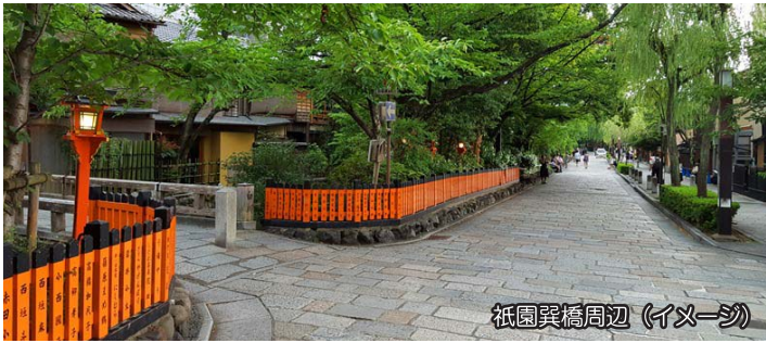
祇園異橋周辺 (イメージ)