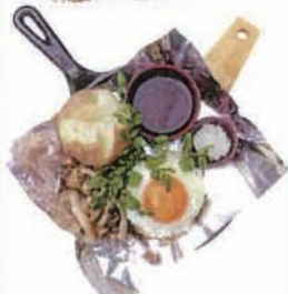
和風ハンバーグステーキ Hamburg steak (Japanese taste) (小麦・卵・乳)