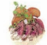
アンガス牛の カイナのステーキ カフェドパリ風ソース Beef steak Café de Paris sauce (乳) [+¥500]