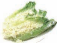
ロメインレタスの シーザーサラダ Caesar salad (小麦・卵・乳)