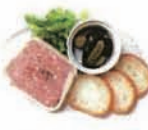
田舎風パテ Pate de champagne (小麦・卵・乳)