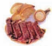
鹿児島県産黒牛ステーキ Wagyu Beef steak (乳) [+¥1500]