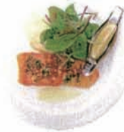
アトランティック サーモンのバターノテー Atlantic salmon sauté (小麦・乳) [+¥100]