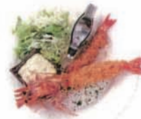
有頭エビフライ Fried prawn (小麦・乳・卵・えび) [+¥940]