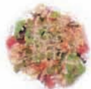
エビとゆで卵の サラダ Shrimp and boiled egg salad (卵・えび)