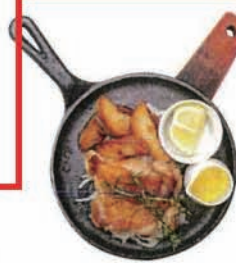
大山鶏のグリル スキレット風 Grilled chicken (乳)