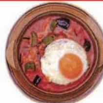
野菜煮込みソースハンバーグ Stewed Hamburg Steak (小麦・卵・乳)