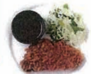
萩原畜産豚の ロースカツレツ Pork cutlet (小麦・卵・乳) [+¥200]