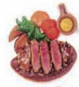
フィレビーフのカツレツ Beef cutlet (小麦・卵・乳) [+¥1100]