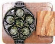
エスカルゴの 香草ガーリックバター Escargot with garlic herb butter (小麦・乳)