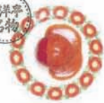
丸ごとトマトサラダ Tomato salad (卵)