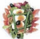
ニース風サラダ Nice styled salad (卵)