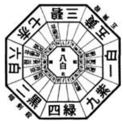
5月の運勢(八白土星の月) 五月六日(立夏)～六月五日(芒種)

滞運の月だから何事も控えめが良い。平常持病のある人は再発に注意。家庭の紛糾や金銭の損失などに注意が肝要。焦って暴走することなく、どつしりと腰を据えて、冷静な状況判断を心がける。吉方位は東・東南・西南