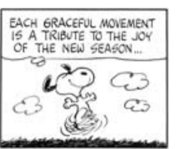
「ピーナッツ」原画(部分) 1972年3月20日

☆「6月15日FC琉球戦」・「6月29日水戸ホーリーホック戦」の観戦チケットをそれぞれ1組2名にプレゼント! プレゼントコーナーをご覧ください。