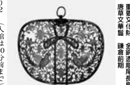
重要文化財 金銅透彫尾長鳥 唐草文華鬘 鎌倉前期