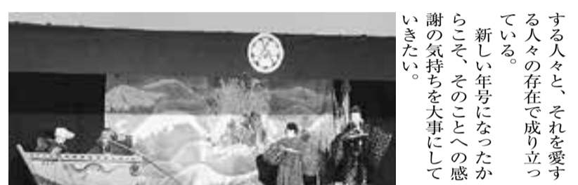
双葉座による文弥人形「太平記嘗れの仇討 檀風の段」の一場面。写真右から二番目が、父の仇を果したばかりの阿新丸。左の二人の船頭は阿新丸を乗せまいと沖へ漕ぎ出すが、阿新丸の師である阿闍梨の祈禱により、岸へ引き戻されて慌てている(筆者撮影)

庶民的な笑いを中心の野呂間人形、坂田金時の息子にして鬼退治で有名な坂田金平を扱った金平人形「山椒大夫」などの道の説く説教人形。この三大人形劇の中に飛び込んできたのが、常盤一と松之助の文弥人形だ。 文弥人形その最大の