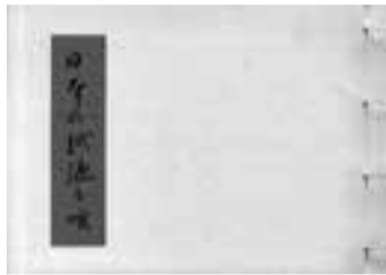
阪田美枝編著「日本の紙漉き唄」