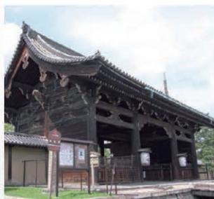
▲ 東寺の中で最も大きい「南大門」。