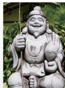
▲ 釣竿と鯛を持った商売繁盛の神。