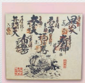
▲ 7箇所の寺社を巡り、ご朱印をいただきます。