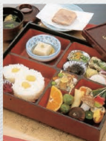
▲ ご昼食イメージ ※若干内容が異なります。